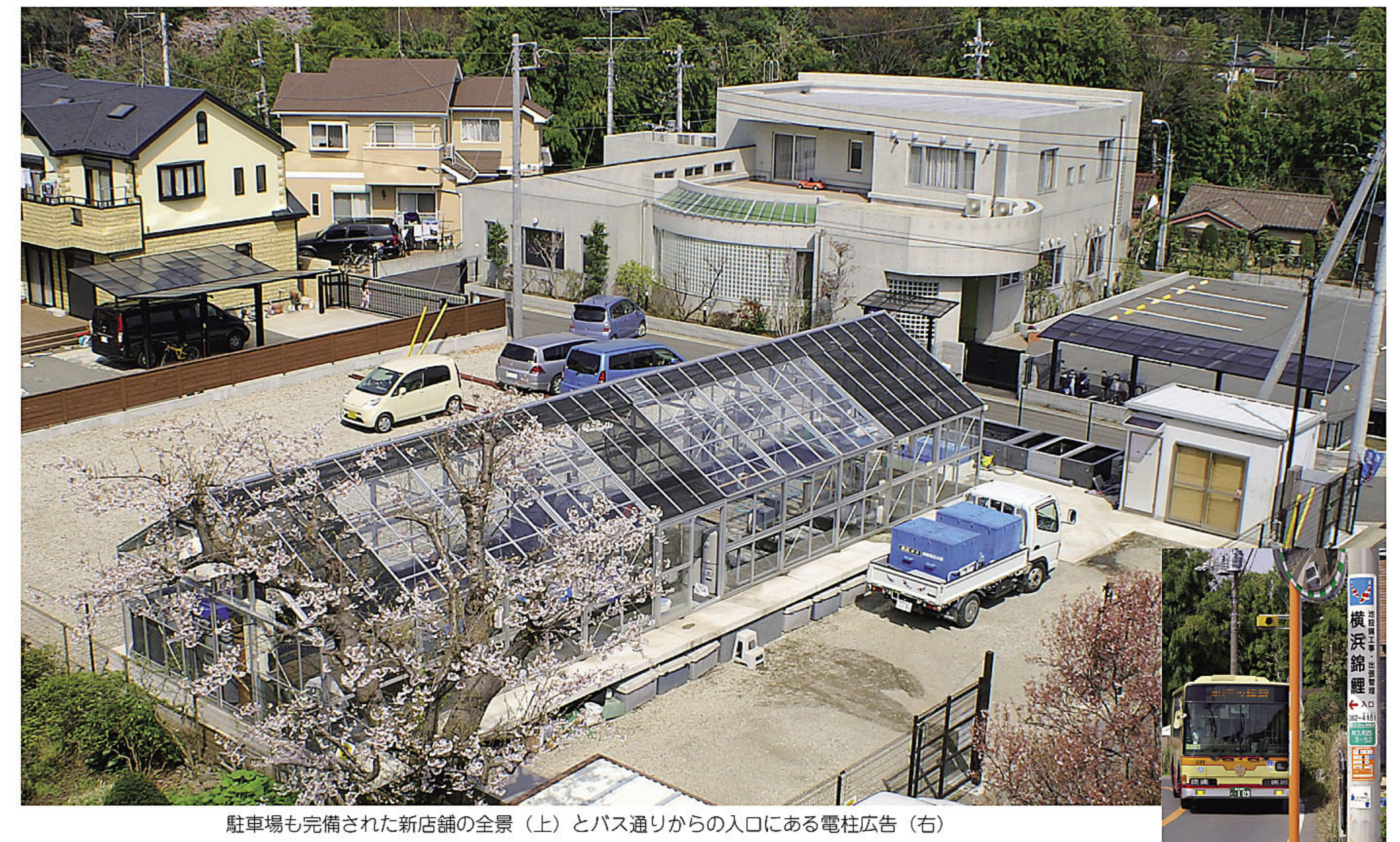
駐車場も完備された新店舗の全景（上）とバス通りからの入口にある電柱広告（右）

KOIYA NI IKOU! KOIYA NI IKOU! KOIYA NI IKOU! KOIYA NI IKOU! KOIYA NI IKOU!